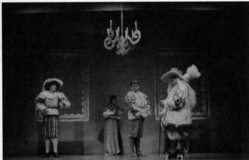
O Burguês fidalgo, 1991