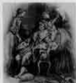
O doente imaginário