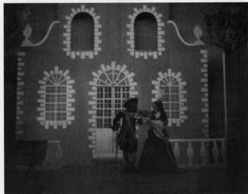
Escola de mulheres, 1970