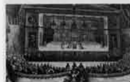
Representação de O doente imaginário