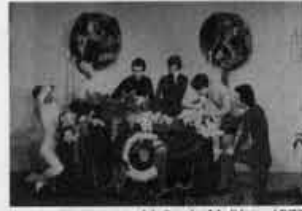
Lição de Molière, 1977