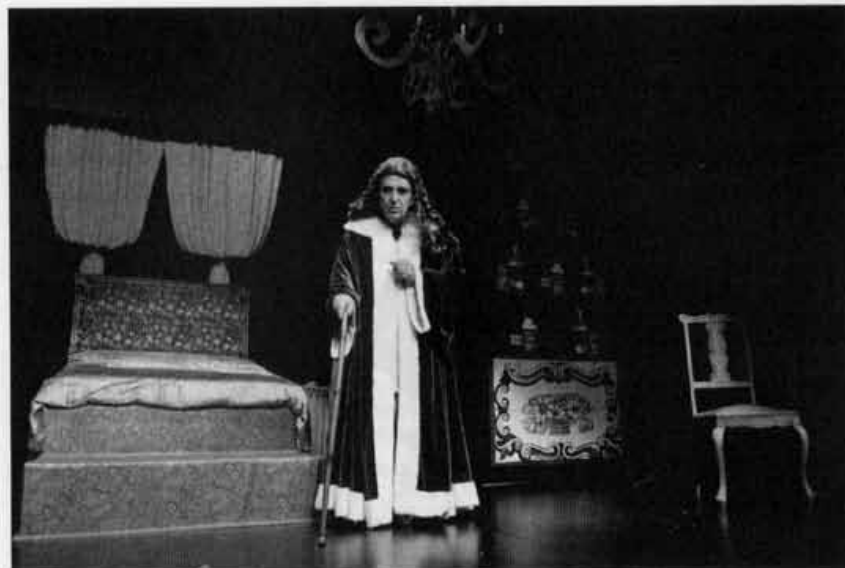
O doente imaginário, 2013

A comédia é um gênero de permanência. Dos gregos à atualidade continuamos a rir dos engodos amorosos, das tramas mal sucedidas e da incomunicabilidade humana.