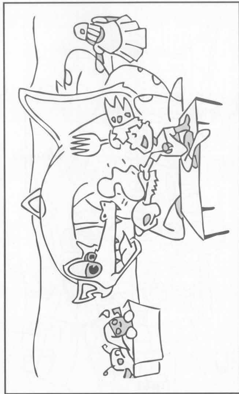
Simbita encontra o dragão que quer ser seu amigo.