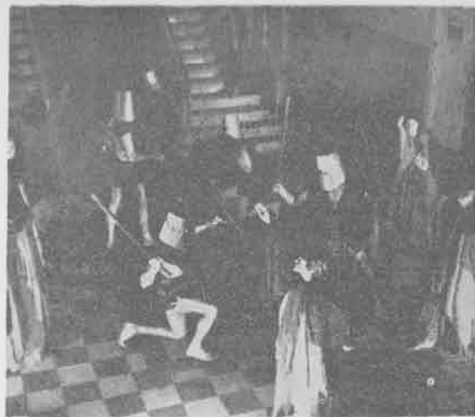
1971 — Escorial