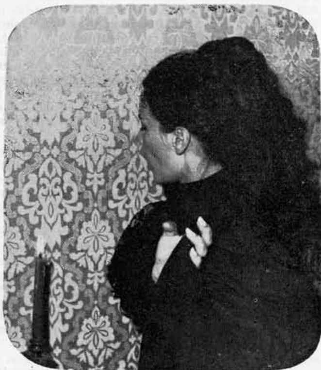
1967 — O urso

Elogia-se o mágico, o artista incomparável; será necessário inclinar-se sobre seu pensamento. É suficiente observar-se, que segundo suas indicações, três das suas obras: “Seis Personagens à Procura de um Autor”, “Assim é se lhe Parece” e ‘Esta noite se improvisa’, são as partes de um tríptico para nela descobrir-se a unidade. Estas três obras, consagradas ao drama do Homem à procura de Deus, de sua condição, de seus fins, se não melhormente compreendidas, conduzir-nos-ão à medida do seu gênio.