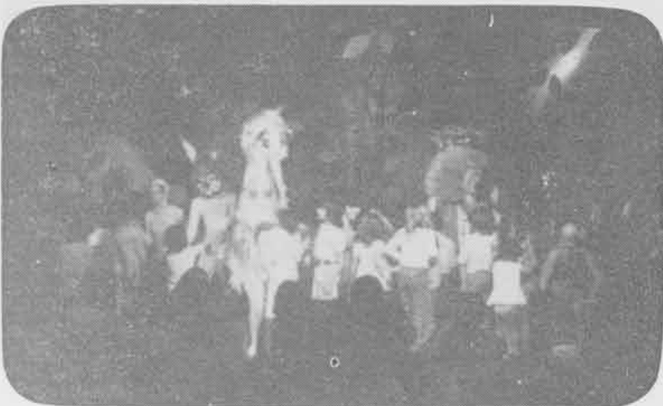
1973 — A onça de asas