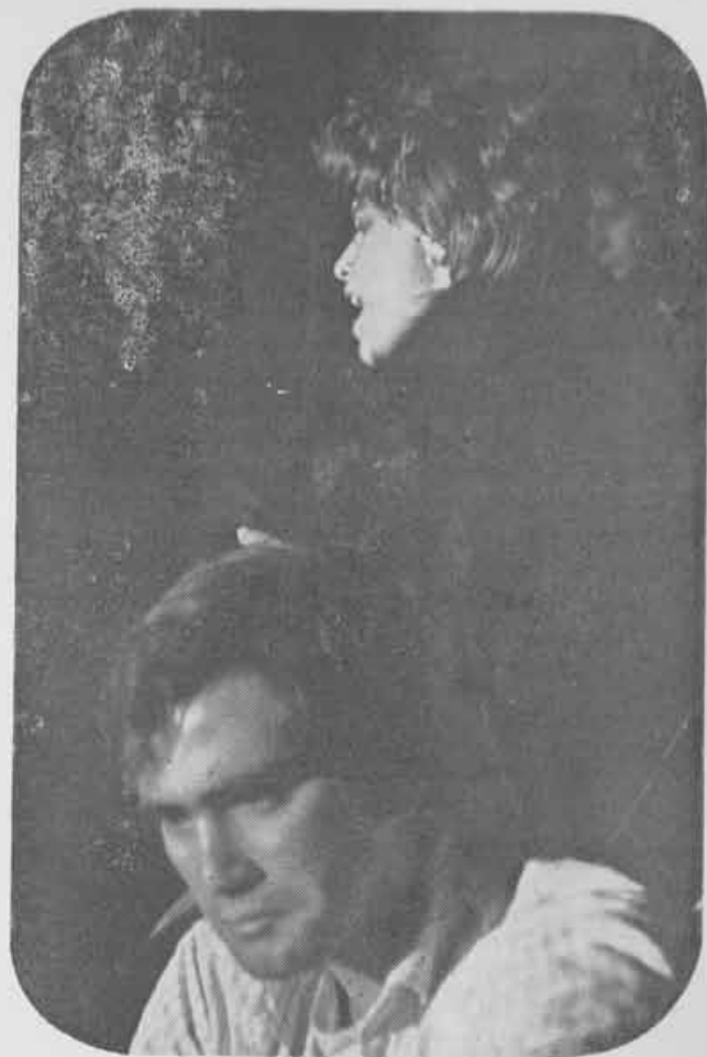
1970 — A visita da velha senhora

“Grupo Divulgação afirma-se realmente, como o melhor grupo de teatro Universitário do Brasil.” (Embaixador Paschoal Carlos Magno).