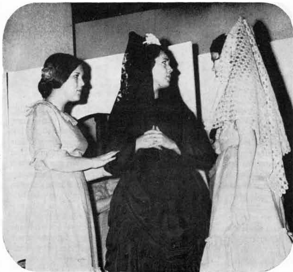
1968 — Bodas de Sangue