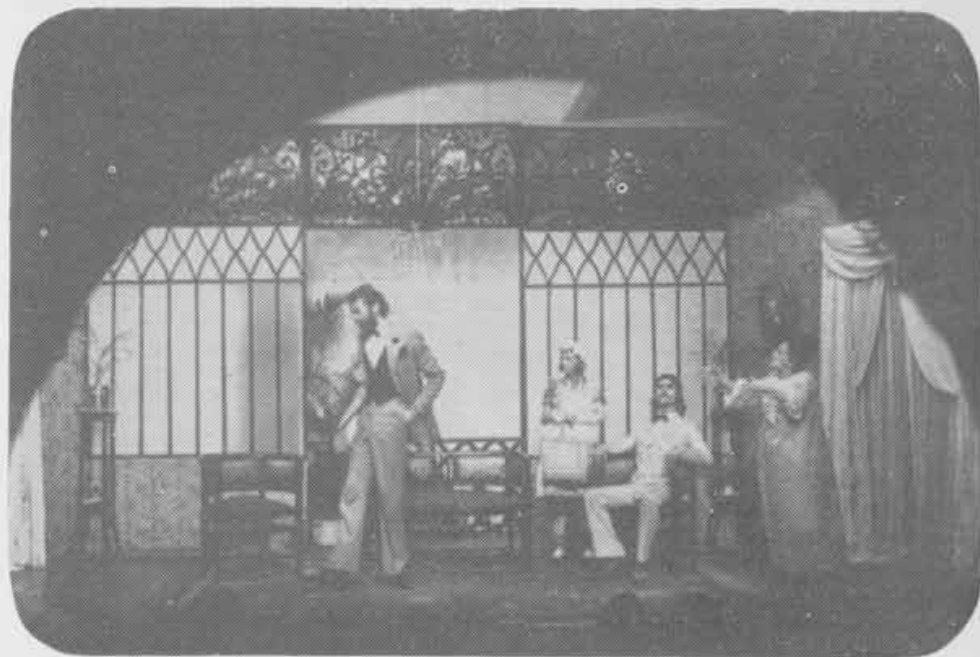
1972 — Os mistérios do sexo