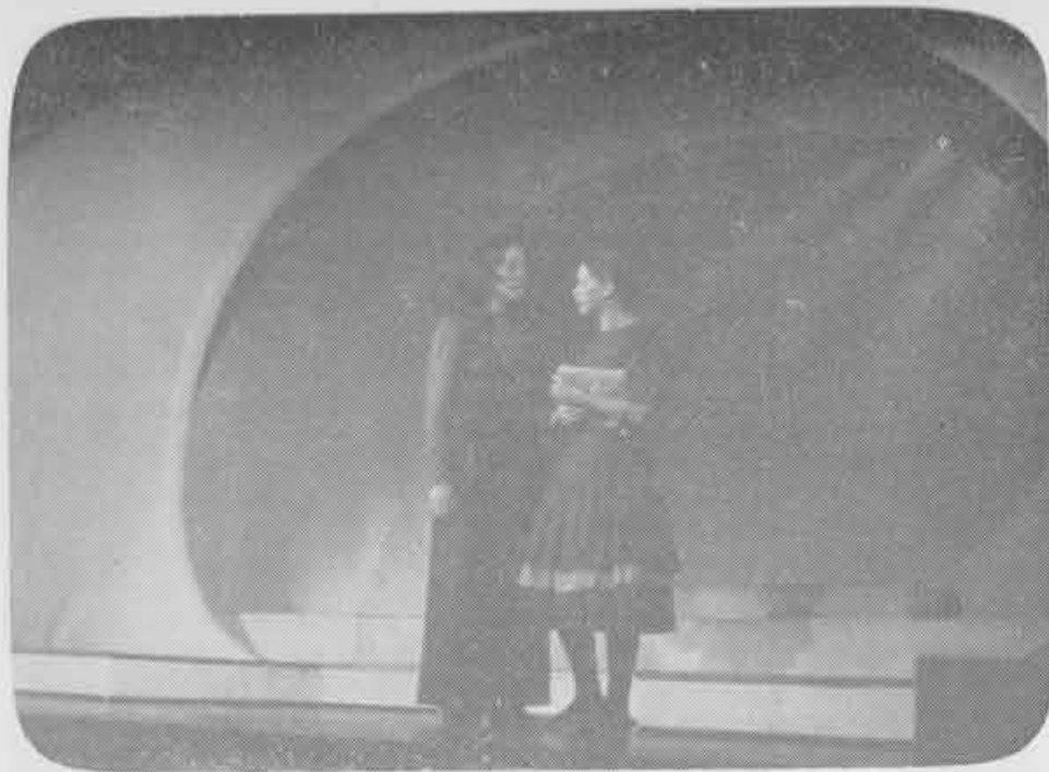
1973 — Yerma