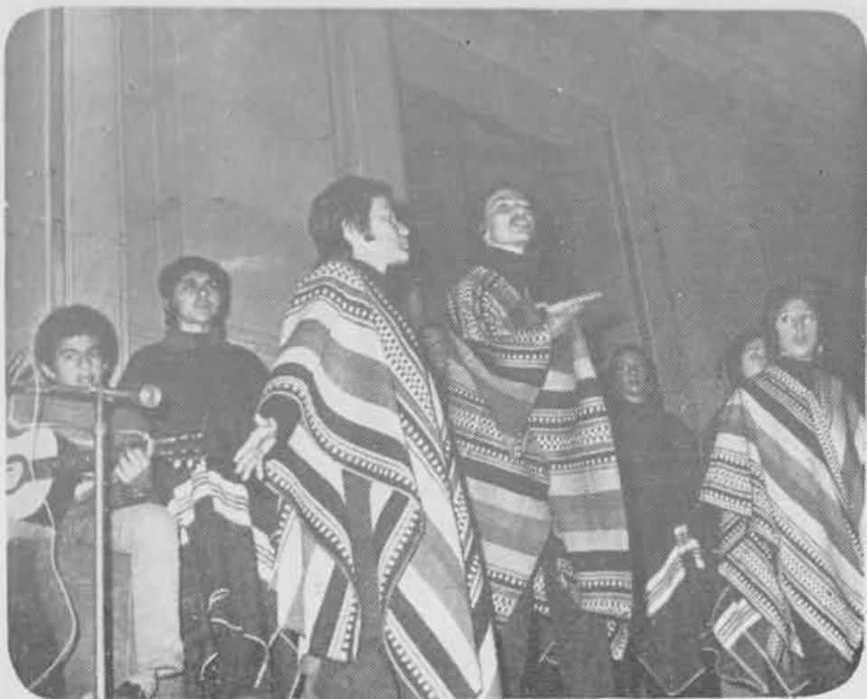
1971 — Romanceiro da Inconfidência