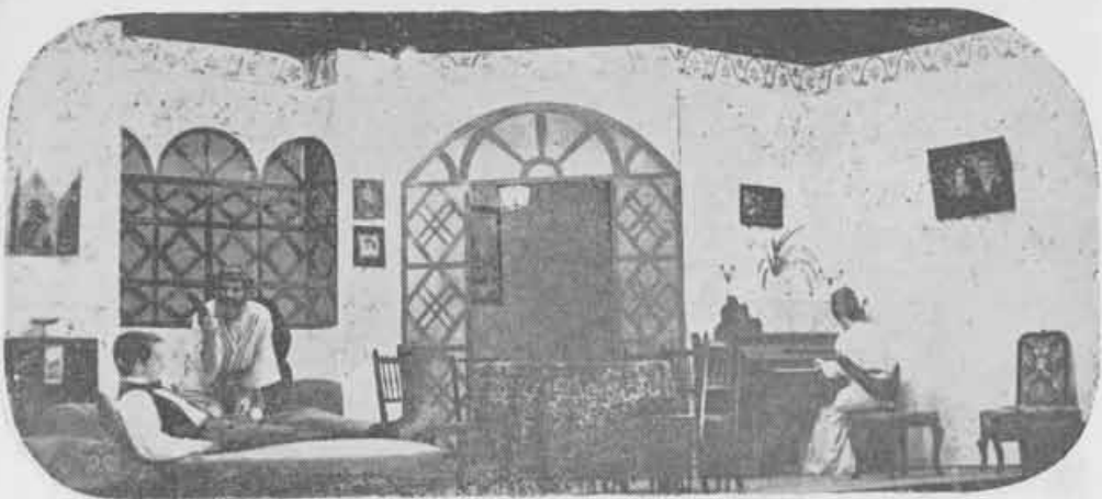
1969 — Pequenos Burgueses