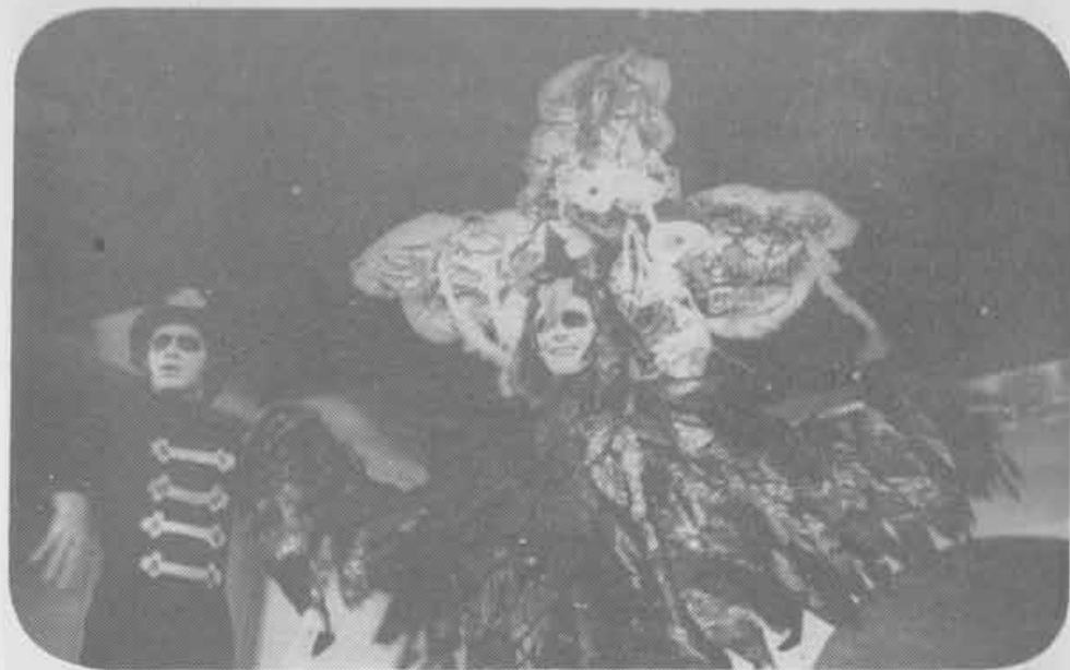
1972 — A morta