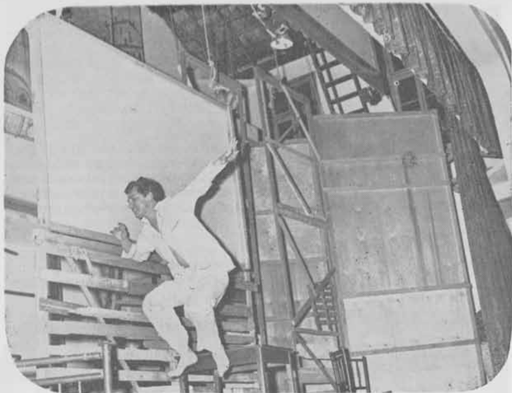
1969 — Diário de um louco