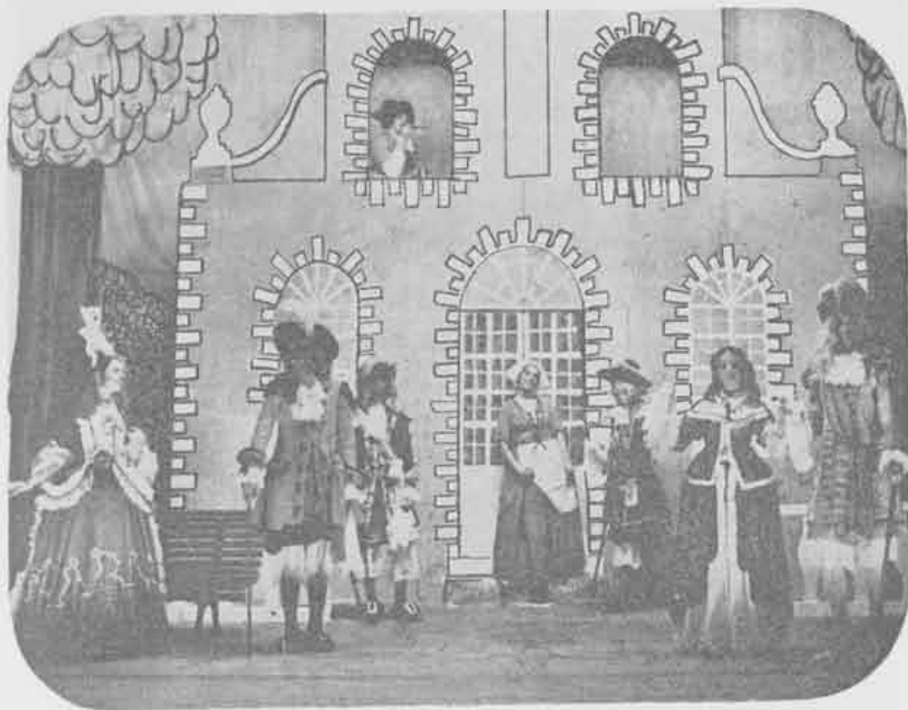
1970 — Escola de Mulheres

"Um repertório deste gabarito, é muito raro ver dentro de grupos brasileiros. Eu nunca poderia imaginar encontrar um Grupo assim em Juiz de Fora. Este trabalho só encontra similar em um grupo brasileiro, o Tablado. O DIVULGAÇÃO — é motivo para colocarmos JF em nossa rota, quando passando por Minas". (Walmir Ayala).