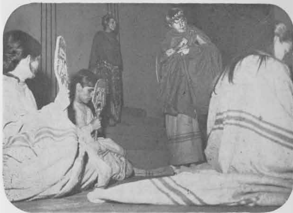
1968 — Electra